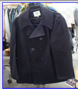
Navy Jacket mod. PEACOT Vintage Made in USA